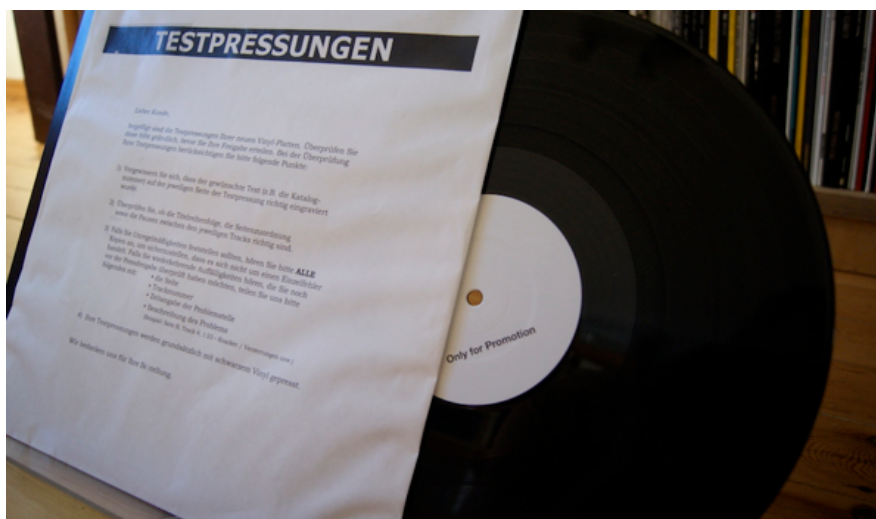
Ry Cooder - Jazz | Die Review zur Weißpressung

Wenn sich ein Musiker wie Ry Cooder dem Jazz widmet, darf man gespannt sein. Bei seiner 1976 erstmals erschienenen Schallplatte „ Jazz “ geht es allerdings keineswegs um authentische Aufarbeitung der Musikgeschichte, sondern um seinen persönlichen Blick in vergangene Epochen. Und wir dürfen uns heute auf eine glänzende Vinyl-Wiederauflage freuen, die eine Suche auf teurere Originale unnötig macht.