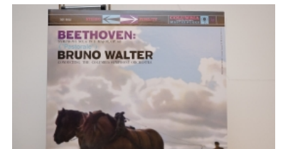
Bruno Walter二張一套貝多芬田園